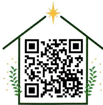
PHIẾU ĐĂNG KÝ BHYT